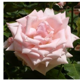
The Healing Rose